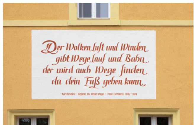
Vers aus dem Lied „Befiehl du deine Wege“ von Paul Gerhardt an der Fassade des alten Bahnhofs Klosterbuch, Leisnig, Sachsen, Deutschland