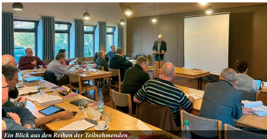
Ein Blick aus den Reihen der Teilnehmenden