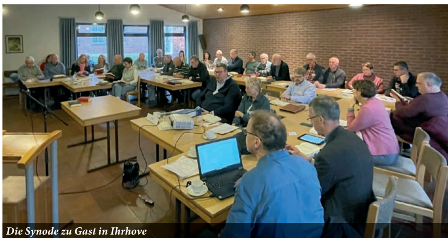
Die Synode zu Gast in Ihrhove

Die zentrale Botschaft für heute ist: Wir leben ebenfalls in einer Welt, deren Schein uns einredet, alles sei in Ordnung. Für Christen bedeutet das, wachsam zu sein, denn „es gibt kein richtiges Leben im falschen“ (Adorno). Der weiße Stein erinnert uns daran, dass Gottes Reich unser eigentliches Ziel bleibt. Anschließend