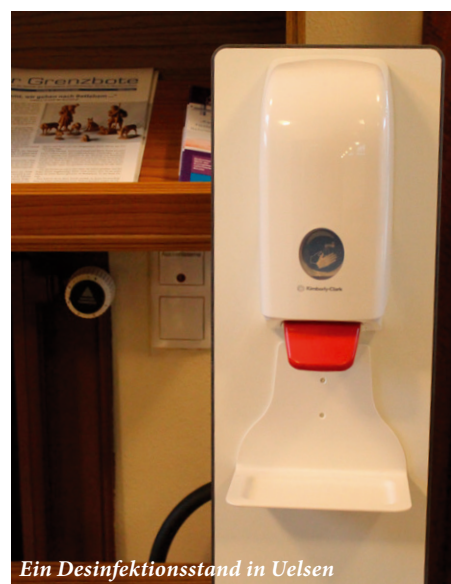
Ein Desinfektionsstand in Uelsen

ne geistlichen Angebote und Möglichkeiten nutzen. Aber das kann man nur vermuten. Was das Ganze dann über den Glauben sagt, kann ich absolut nicht sagen. Die grundsätzliche Herausforderung ist ja nicht anders als bei jedem schwer kranken oder sterbenden Menschen auch – nur dass jetzt nicht nur einige wenige in diesen Prozess mit hineingenommen werden, sondern irgendwie alle. Das könnte bei manchem dazu führen, dass er sich intensiver eben auch mit den fundamentalen – eben religiösen – Fragen auseinandersetzt. Aber vermutlich braucht man mehr Abstand, um das wirklich sagen zu können.