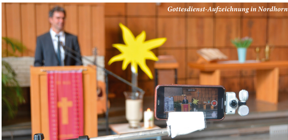
Gottesdienst-Aufzeichnung in Nordhorn

übernehmen wollen oder können, wenn sich auch nur eine Person bei uns im Gottesdienst infiziert und dadurch direkt oder über Umwege ein Mensch zu schweren Schäden oder sogar zu Tode kommt. Die Antwort liegt auf der Hand: Natürlich, eine solche Verantwortung will niemand übernehmen und es kann sie auch keiner übernehmen. Die Schwäche dieses Argumentes (wie sie für alle Totschlagargumente gilt) liegt aber darin, dass wir uns dieses Argument irgendwann wieder abgewöhnen müssen, wenn wir denn überhaupt irgendwann wieder gemeinsam Gottesdienste feiern wollen. Dieses Argument ist zwar immer richtig, darf aber nicht immer gelten. Wer dürfte es sonst wagen, ein Auto zu fahren. Und hier könnten viele weitere Beispiele genannt werden. So bleibt die Frage, wann und wo und wie lange dieses Argument denn gelten darf? Eine sachlich begründete Antwort wird sich kaum finden lassen. Es bleibt oft nicht mehr als ein Gefühl, mit dem wir uns berechtigt sehen, dieses Argument wohl oder nicht zu nutzen. Und schließlich bleibt mit Blick auf dieses Restrisiko die Frage, wie viel Verantwortung hier dem Einzelnen und wie viel der Kirche (und jetzt insbesondere den Kirchenräten) zukommt?