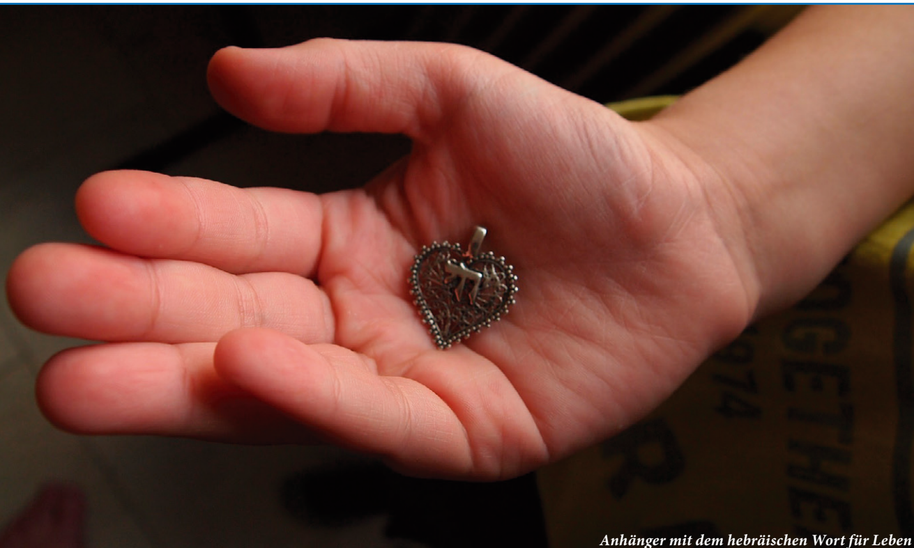
Anhänger mit dem hebräischen Wort für Leben